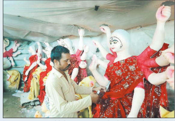
अनुपपुर। नगरत्र शुरू होने में साप्ताह्यार का समय बचा है। मूर्तिकार मा दुर्गा की प्रतिमाओं को मध्य रूप देने में जुटे हैं। कोतमा

बुकिंग भी प्रारंभ हो गई है। 22 सितंबर से शुरू होने वाले नगरत्र पर्व को लेकर लोगों में काफी उत्साह है। मा दुर्गा की प्रतिमाओं को मध्य रूप देने के लिए मूर्तिकार दिन-रात काम में जुटे हुए हैं। मूर्तिकारों ने बताया कि वह स्वयं मूर्ति बना रहे हैं। समय से लोगों को मूर्तियां देने के लिए काम जारों पर किया जा रहा है। नगर में शास्त्रीय नगरत्र पर्व की तैयारी जारों पर है। नगरत्र पर्व को लेकर श्रद्धालुओं में भारी उत्साह है। दुर्गा पूजा समिति के सदस्य तैयारियों में जुटे हुए हैं। दुर्गा प्रतिमा तैयार करने में मूर्तिकार और पूजा पंडाल को आकर्षक बनाने में समिति के सदस्य लगे हुए हैं।