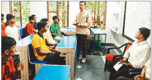
नवोदय पहुंचे एसडीएम और डीईओ।