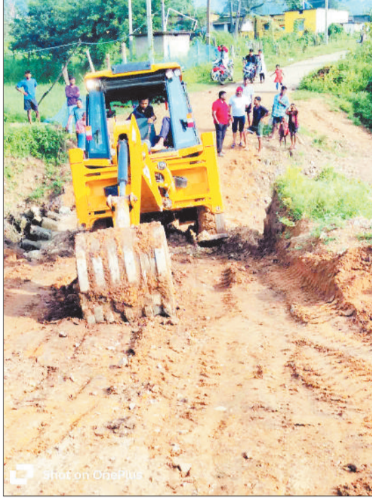
पुलिया मरम्मत कराते ग्रामीण।

मरम्मत कराने जनप्रतिनिधि सहित प्रशासन से लगा चुके हैं गुहार